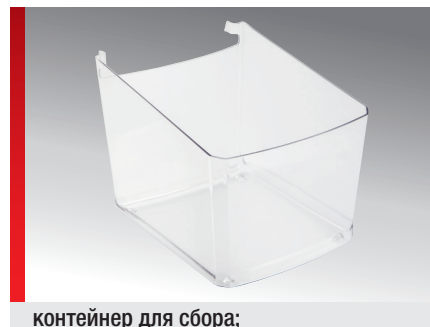
контейнер для сбора;