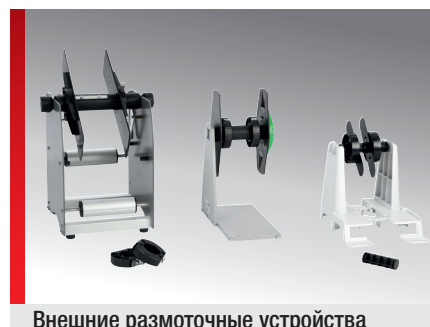
Внешние размоточные устройства